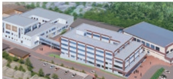
能代科学技術高等学校 教室・特別・管理棟機械設備工事