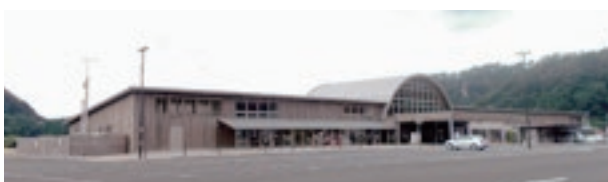
道の駅ふたつ整備事業建設工事 ・給排水衛生設備工事 ・空調調設備工事